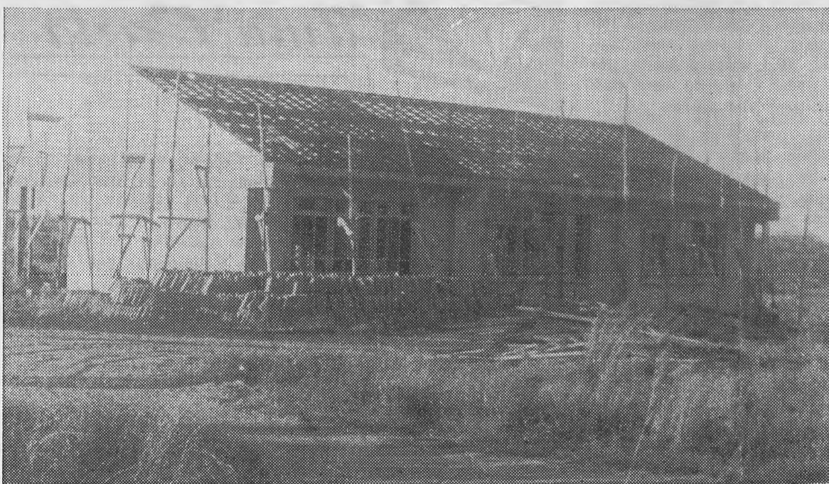
EDIFÍCIO DAS ESCOLAS DA CASA DO GAIATO DE LOURENÇO MARQUES.